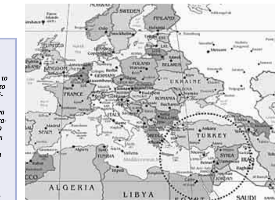
Η Κύπρος είναι η μόνη χώρα της ΕΕ που βρίσκεται στη Μέση Ανατολή. Η γεωπολιτική της θέση είναι εξαιρετικά ελκυστική για την ανάπτυξη οικονομίας γνώσης.

αποσπασματικά σε κάποιες εισηγήσεις - που αναδεικνύουν πιθανές οδούς μετασχηματισμού, αλλά και κάποιες επιστημονικές. Η αναδίεξη της Κύπρου στο Κέντρο Εκπαιδευτικών και Ιατρικών Υπηρεσιών, είναι μια πολυσυζητημένη πρόταση, αλλά η συγκεκριμενοποίηση και οι στοχευμένες επιλογές δεν είναι. Δεν θα επεκταθώ σε αυτό το θέμα, αλλά θέλω να επισημάνω μια καθοριστική πιεστική παράμετρο. Η επιτυχία του εγχειρήματος αυτού θα εξαρτηθεί όχι από την έκταση, αλλά πρωταρχικά από την ποιότητα της εκπαίδευσης ή των υπηρεσιών υγείας που θα προσφέρονται. Είναι σημαντικό να αναδείξουμε τις ιδι-